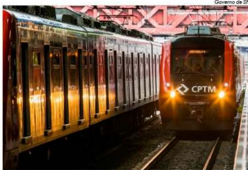
Na Linha 10 a mudança ocorre nas estações Ipiranga, Tamanduateí e Juventus-Mooca

A partir deste sábado, 1º de fevereiro, as bilheteiras administradas pela Companhia Paulista de Trens Metropolitanos (CPTM) de 30 estações das Linhas 7-Rubi, 8-Diamante, 9-Esmeralda, 10-Turquesa e 12-Safira passarão a funcionar das 5h às 21h.