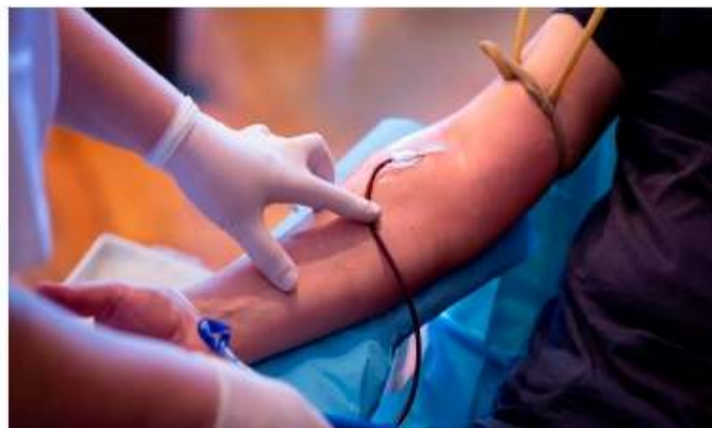
Processo inteiro de doação dura menos de uma hora e pode salvar até quatro vidas

A doação regular contribui para a manutenção dos estoques dos hemocentros, que precisam repor continuamente certos tipos sanguíneos. O processo inteiro de doação dura menos de uma hora, retira no máximo 450 ml deste tecido líquido vital e pode salvar