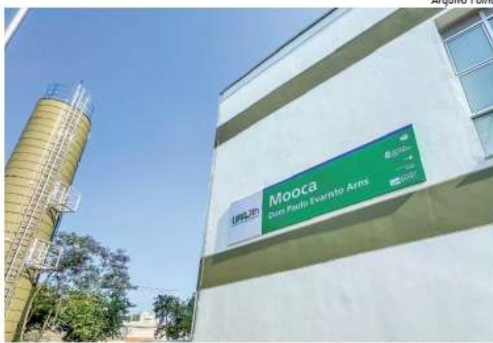
Unidade foi inaugurada em setembro de 2021

ção das melhorias, nossa expectativa é de que as UPAs estejam operando com fluxos mais rápidos para o atendimento inicial e diagnóstico dos pacientes em condições críti-