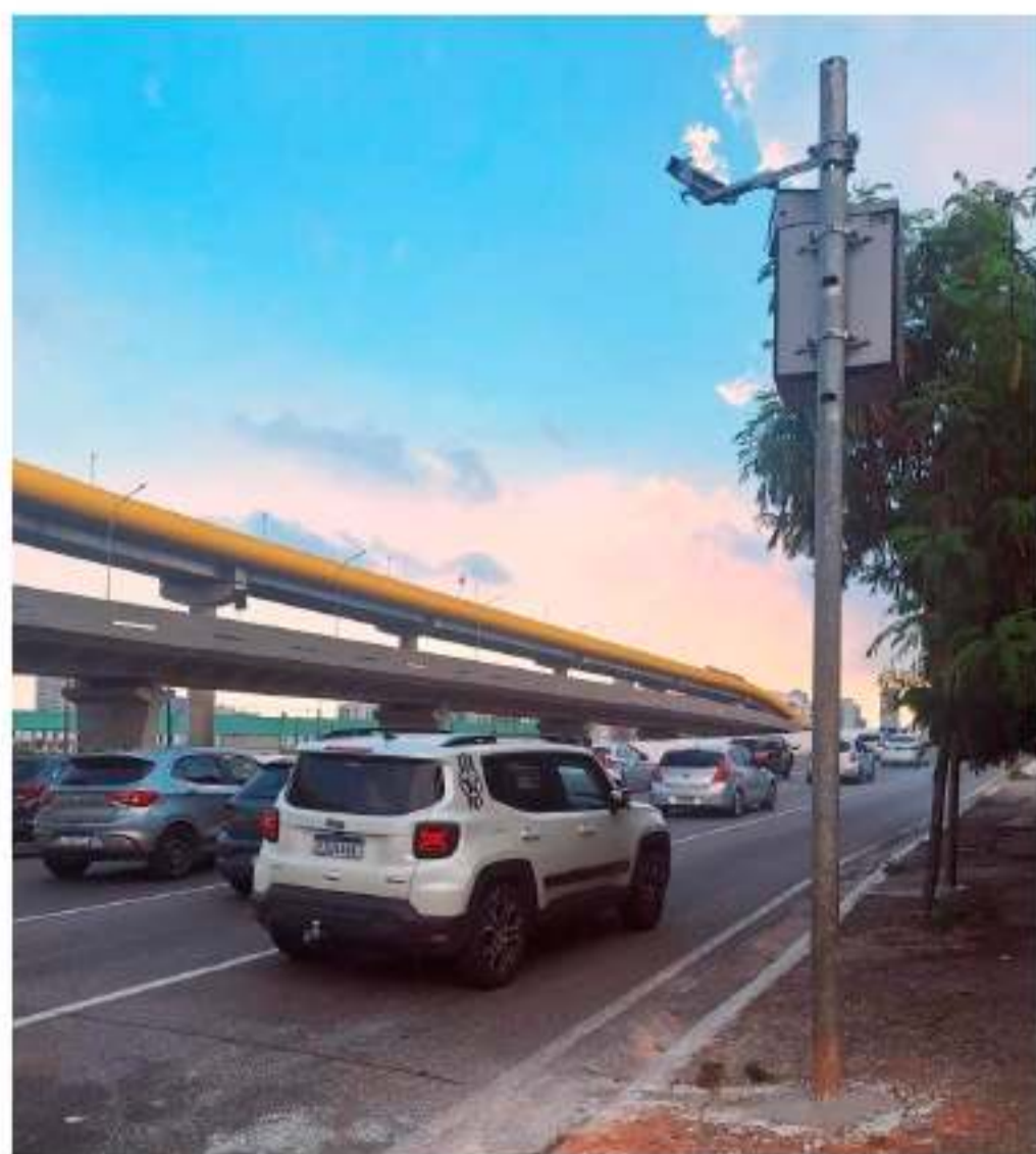
Vice-campeão de multas em 2023 radar do Viaduto Grande SP volta a operar

MULTAS A MIL – Os dados são do site Observatório de Mobilidade Segura. Em 2024, não foi divulgada a captura de infrações