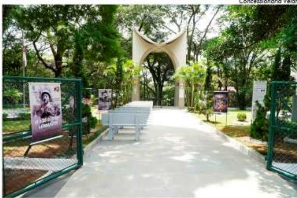
Espaço guarda os restos mortais de 176 pracinhas que estiveram na guerra entre 1944 e 1945

Entre as benfeitorias, foi realizada a construção de calçadas de acesso, instalação de pisos cerâmicos com drenagem e de 200 m² de grama, afixação de placas nos túmulos e melhorias na iluminação e na segurança do local.