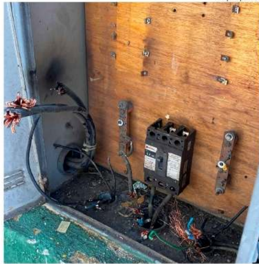
Invasores também arrombaram caixa de luz

terial e financeiro, a entidade social também terá despesas extras para reforçar a segurança e o monitoramento no imóvel.