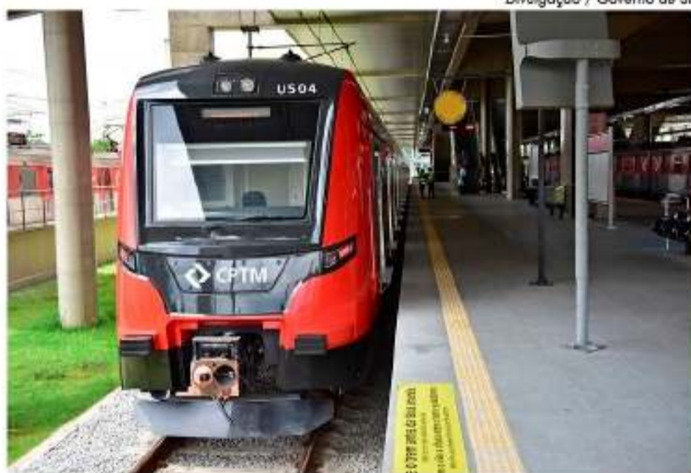
Previsão de mais uma parada da linha na Mooca

Outra promessa do Estado é que a proposta também visa minimizar as interrupções causadas por alagamen-