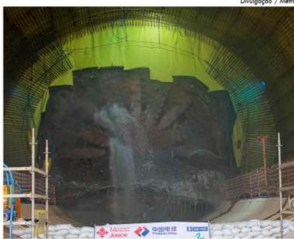
Tuneladora deve chegar ao canteiro de construção da estação até o final deste mês

previsto realizar o remanejamento de outras 18 famílias devido à partida do Tatuão da estação Orfanato em direção ao poço de Ventilação e Saída de Emergência (VSE) Falchi Gianini. O Metrô garantiu