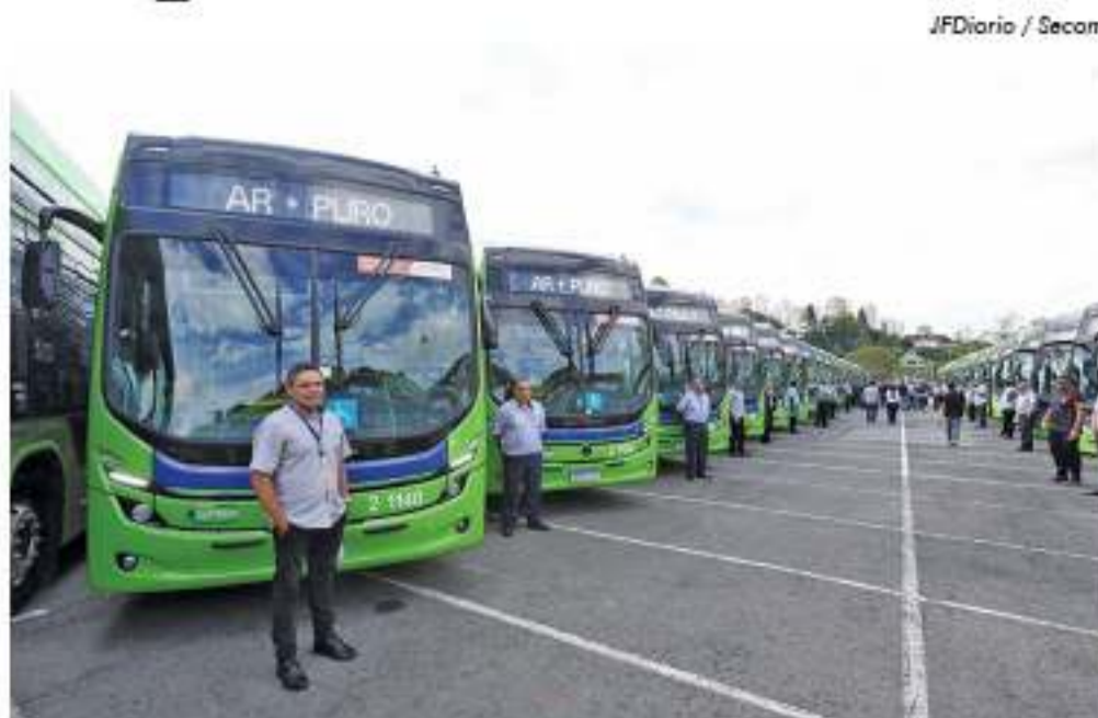
Mais 60 coletivos foram entregues nesta semana

A Prefeitura entregou na segunda-feira, dia 3, mais 60 ônibus elétricos para compor a frota municipal de transportes públicos. A cidade soma agora 1.009 coletivos movidos a energia limpa, sendo 820 a bateria e 189 trólebus. Segundo a São Paulo Transportes (SPTrans), na região são mais de 40 ônibus elétricos atuando em diversas linhas (veja abaixo).