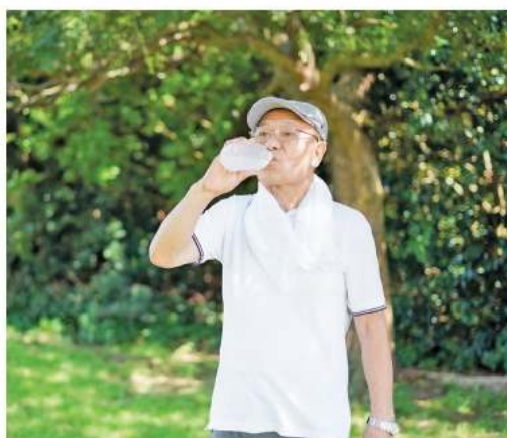
Com o avanço da idade, a sensação de sede diminui

A desidratação dá sinais como confusão mental, agitação, cansaço excessivo e sonolência, além de aumentar as chances de tonturas e quedas. Outros