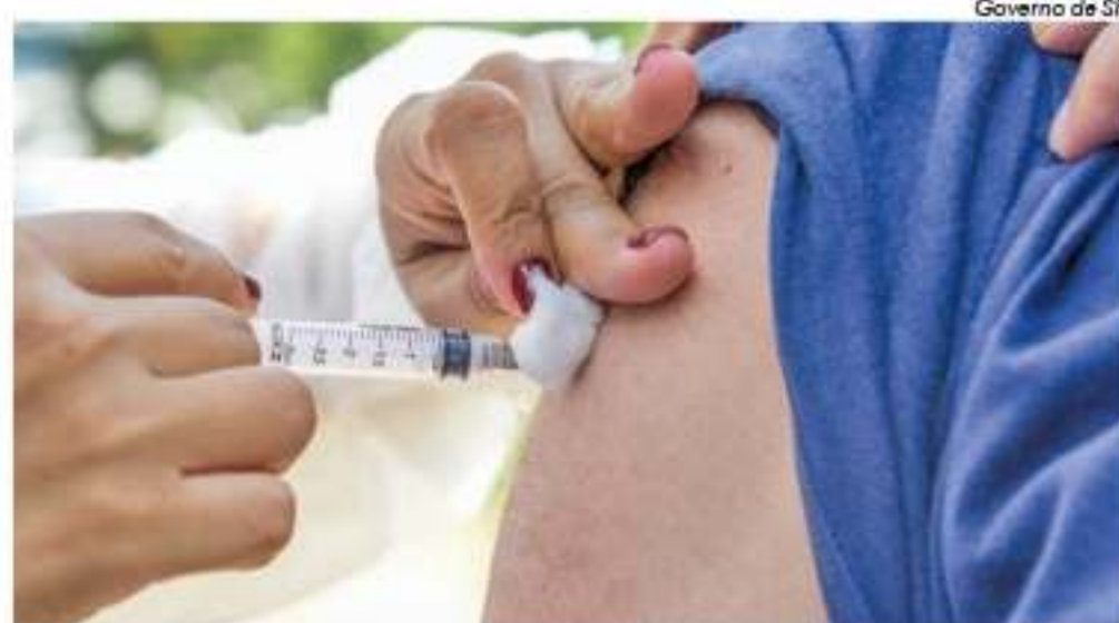
Cuidado é reforçado após a confirmação de um novo caso da doença na capital paulista

epidemiológico da vigilância estadual. A imunização é a principal forma de prevenção contra o sarampo. A vacina tríplice viral protege