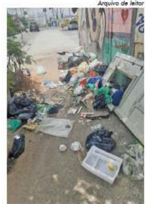
Rua Dianópolis, na Mooca

A Subprefeitura destacou ainda que a aproximadamente 1,86 km do ende-