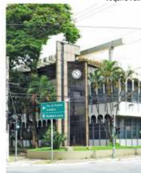
Relógio histórico não está mais na Mooca