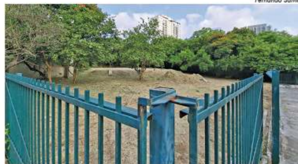
Foi realizado mutirão de limpeza no terreno

Foi publicado nesta semana no Diário Oficial, o edital para contratação de obras e serviços para implantação do Parque Municipal Vila Ema, no terreno situado na rua Batuns com a avenida Vila Ema. A licitação será aberta no dia 16 de abril, às 9h30.