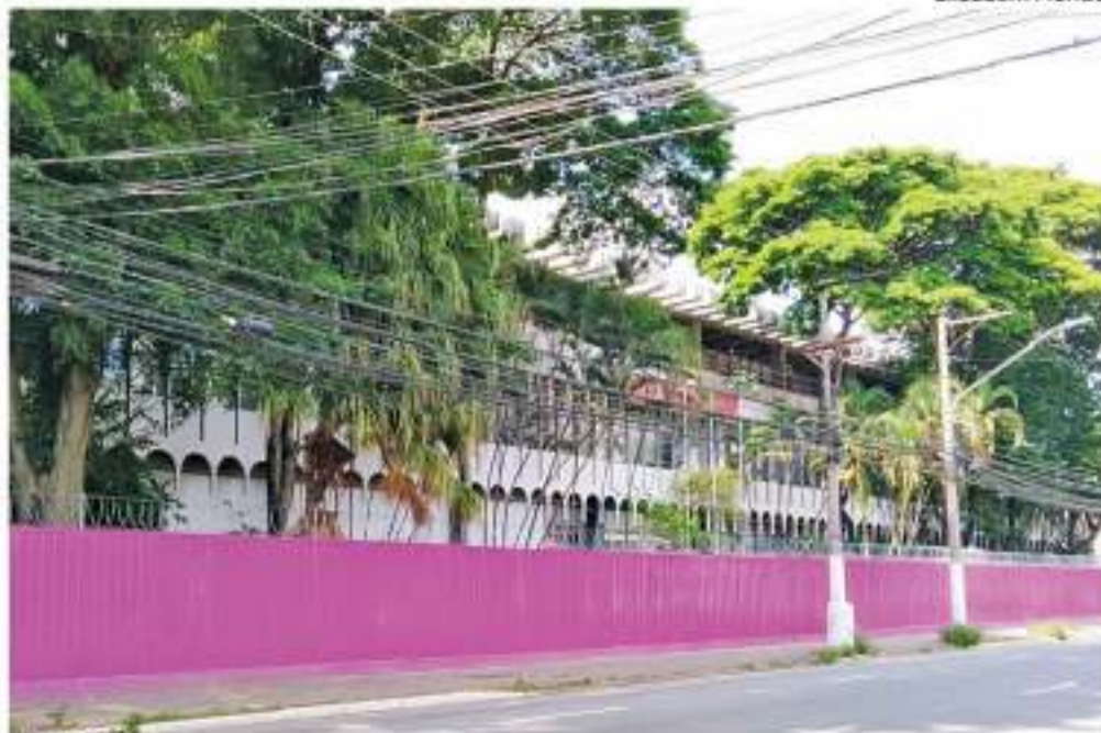
Espaço na rua da Moca foi cercado por tapumes

seguintes foi passando por transformações. Desde 1995, o parque gráfico havia sido modernizado e foi criada uma editora, que publicou diversos títulos, com selo próprio e em parceria, que ajudaram na preservação da memória cultural do estado. Depois, passou a ser a Autoridade Certificado Digital de São Paulo. Em 2024, a Imprensa Oficial concluiu a migração para o sistema totalmente digital do Diário Oficial.